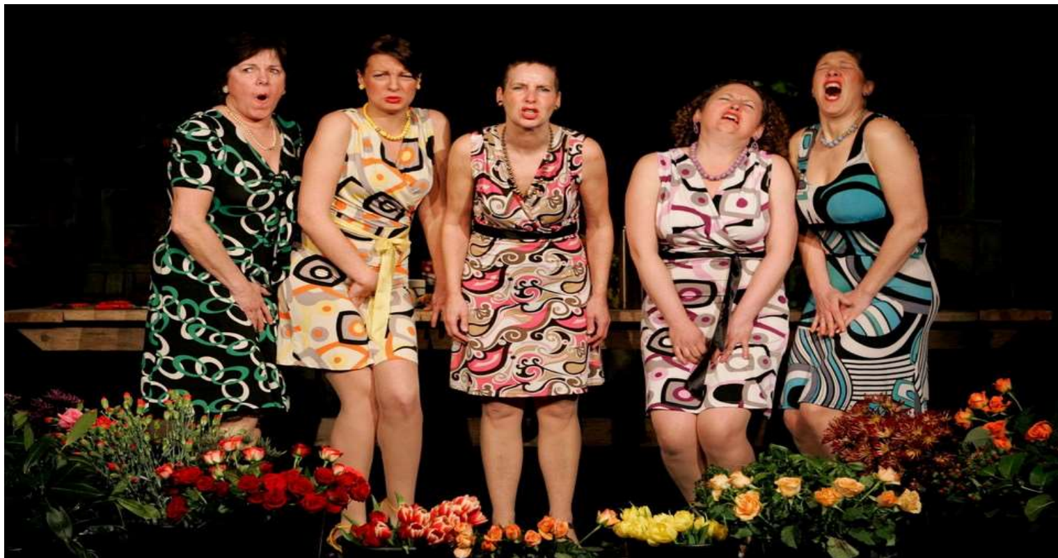
Scene uit 'De vaginamonologen', De Bron in 2009.